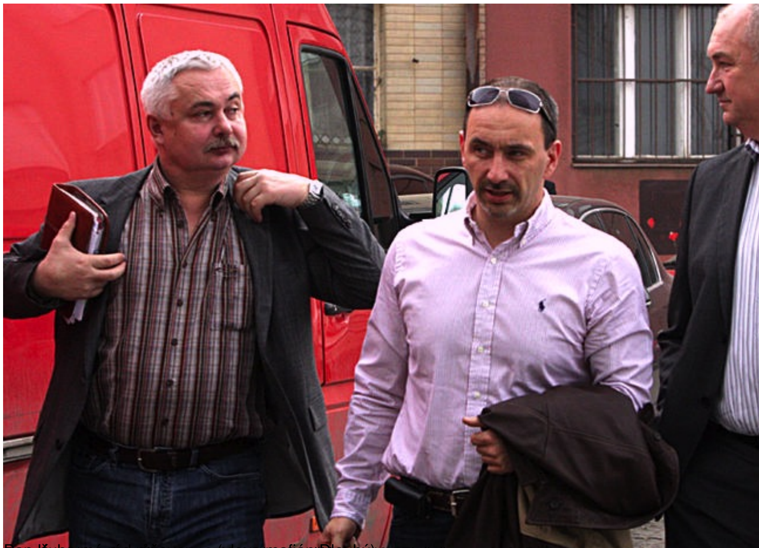
Pan Kuba | úterý 29. říjen 2012 (10:00 | kampaň | články 4,3,57 | přečteno: 28285 x